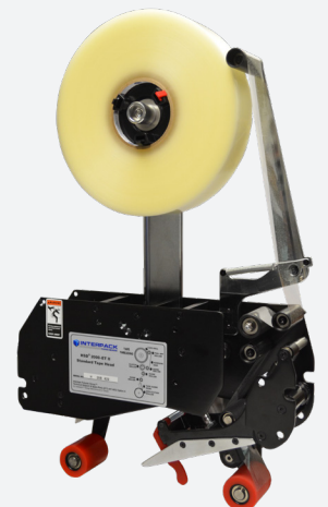
ET 2Plus tête de bande

Lorsque vous comparez les caractéristiques, les avantages et la valeur, les scelleuses de caisses Interpack sont le bon choix pour les opérateurs, les ingénieurs d'usine, la maintenance et les achats.