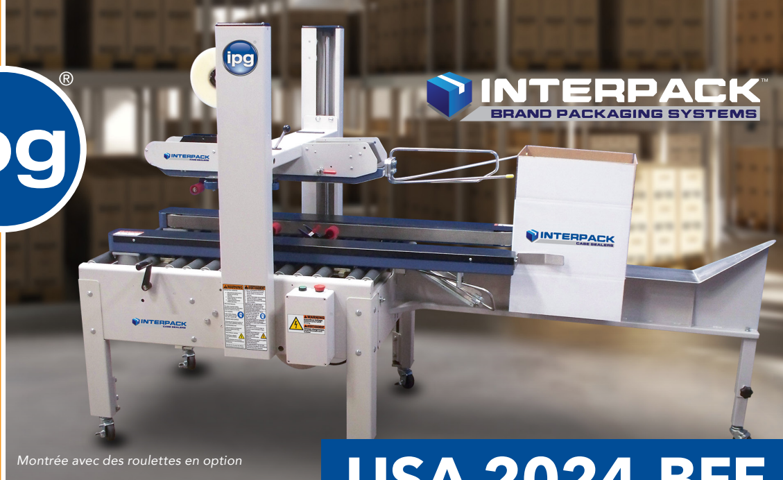
Montrée avec des roulettes en option