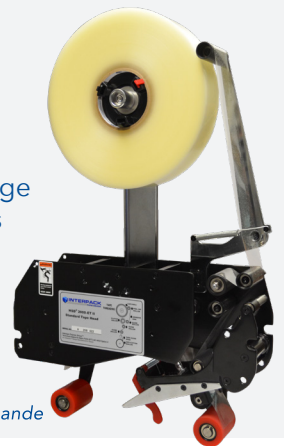
ET 2Plus tête de bande

Lorsque vous comparez les caractéristiques, les avantages et la valeur, les scelleuses de caisses Interpack™ sont le bon choix pour les opérateurs, les ingénieurs d'usine et les services d'entretien et d'achats.