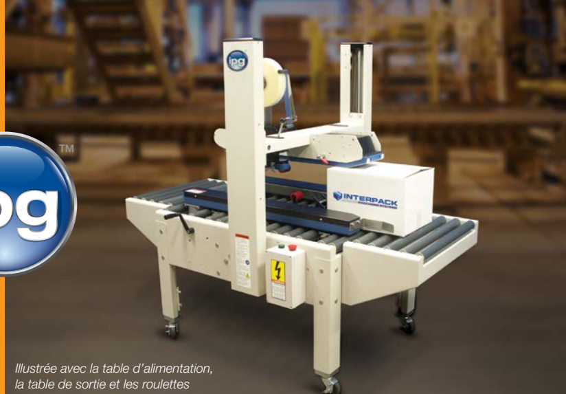
Illustrée avec la table d'alimentation, la table de sortie et les roulettes